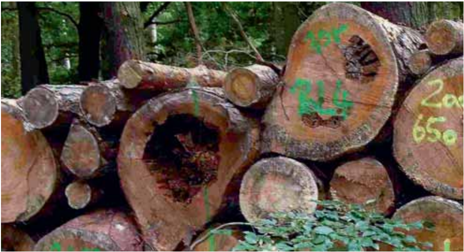
Brennholzpolter mit verpilzten Arealen, Groß- höhlen und großem Mulmkörper

und den gesetzlichen Vorgaben entspricht. Dieser Fall offenbart, dass Forst- und Naturschutzverwaltungen hier reihenweise versagt haben. Zuerst bei der Planung, dann bei der Durchführung der Maßnahmen und abschließend bei der Kontrolle. Diese Zustände sind nicht tragbar und müssen sich ändern. Gerade beim Vorkommen seltener Tier- und Pflanzenarten, insbesondere von Anhang II- und Anhang IV-Arten nach der FFH- und SPA-Richtlinie, muss darauf Rücksicht genommen werden und die Naturschutzverwaltung ist vor Durchführung der Maßnahme mit einzubeziehen. Der Höhepunkt des Skandals besteht allerdings darin, dass bei der oben genannten Abschlussbesprechung in großer Runde quasi ein „Persilschein“ für den Raubbau beziehungsweise für Verstöße gegen das Verschlechterungsverbot der FFH-Richtlinie ausgestellt wurde. Hier müssen personelle Konsequenzen gezogen werden. Ebenso macht dieser Vorfall überdeutlich, dass eine ordnungsgemäße Forstwirtschaft im Sinne einer guten fachlichen Praxis definiert werden muss.